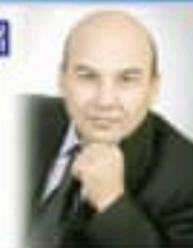
Хузубек ХАМДАМ, Ўзбекистон Республикаси Фанлари Академияси