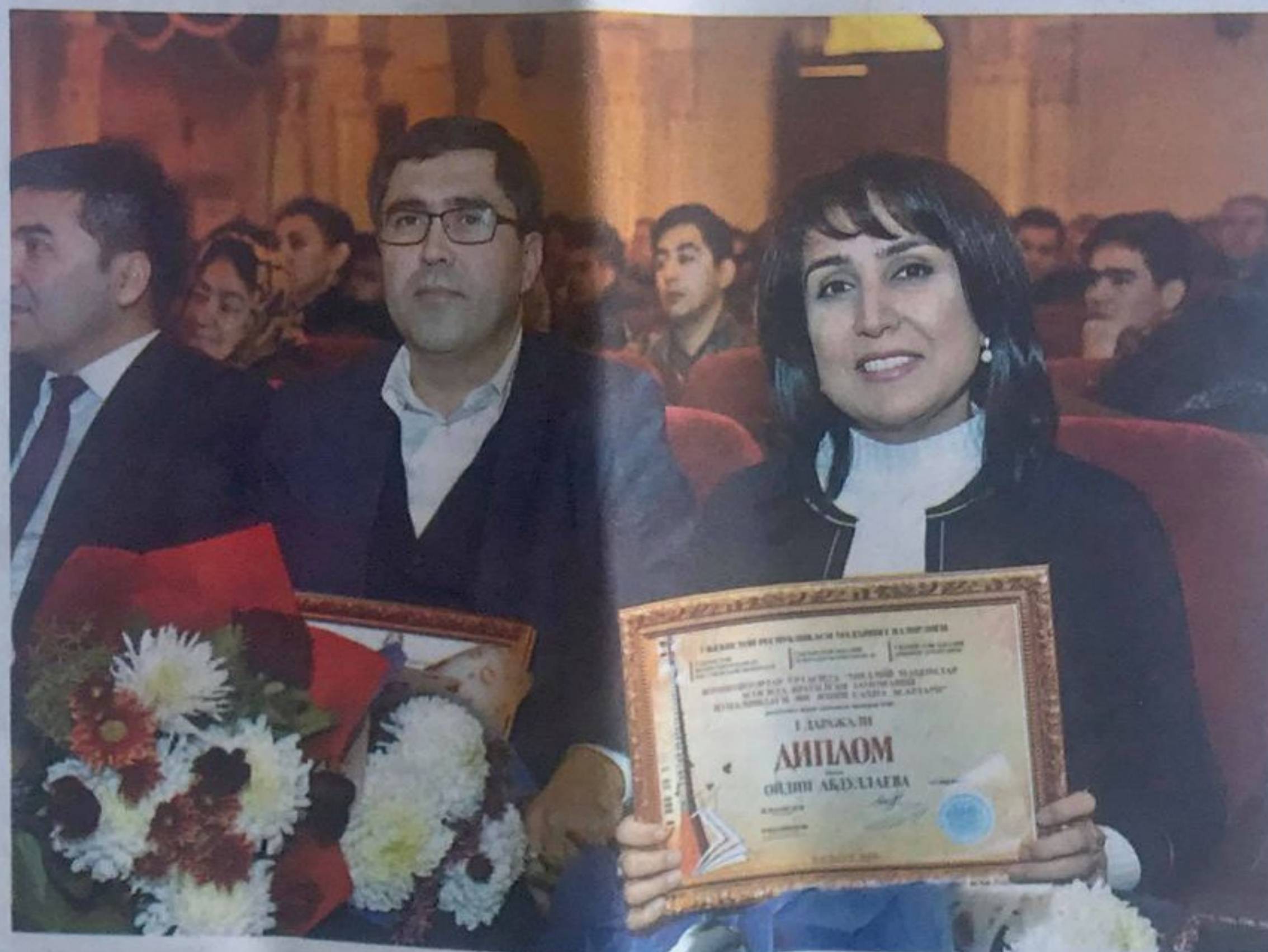
“Мақом йўлларидан яратилган энг яхши асар”

мўъжиза”, Исажон Султоннинг “Қорақуш юлдузининг сири”, Зулфия Қуролбой қизининг “Аёл”, Лукмон Бўрихоннинг “Марҳаматли кун”, Назар Эшонқулнинг “Момоқўшиқ” китоблари эндиликда китобхонларнинг севимли асарлари бўлишига эришилди.