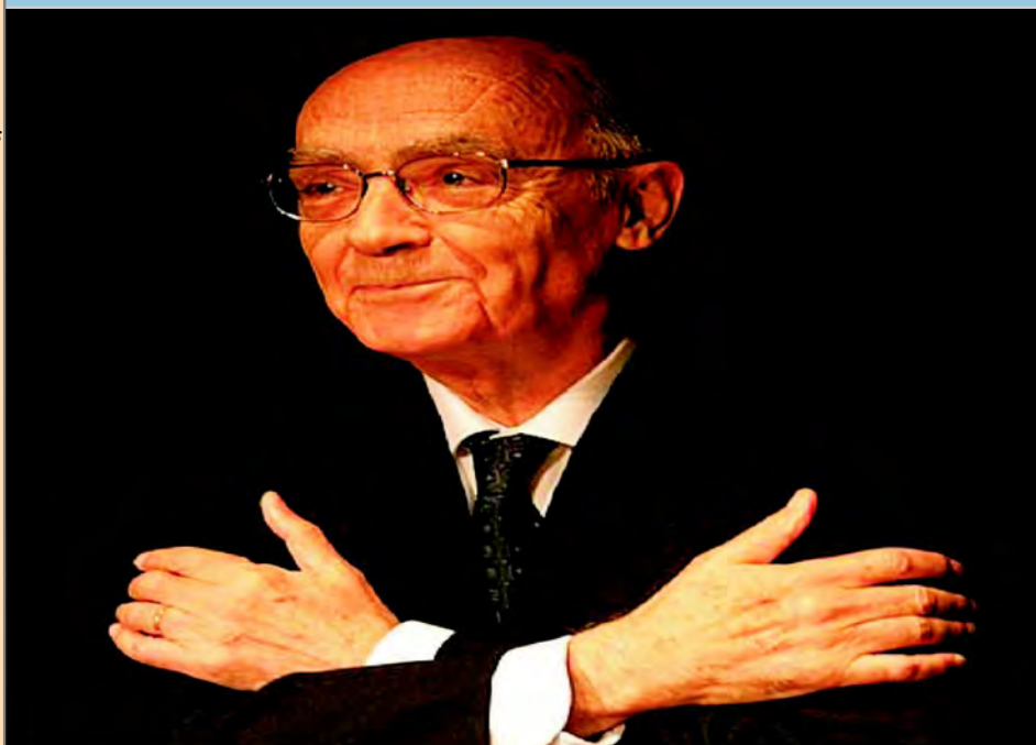
Gjithçka rreth nobelistit Jose Saramago