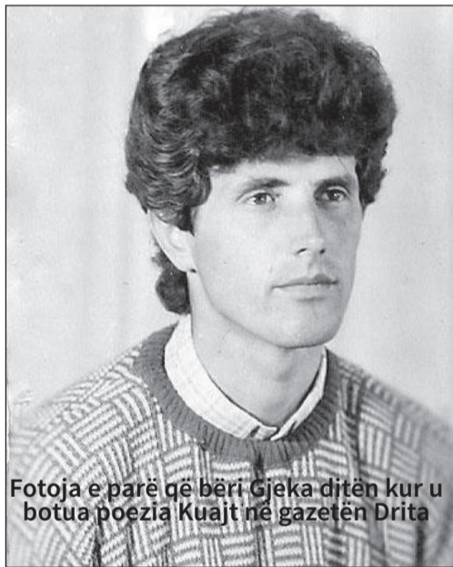
Fotoja e parë që bëri Gjeka ditën kur u botua poezia Kujt në gazetën Drita