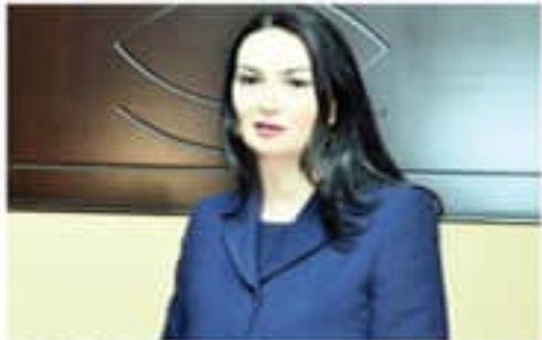
"Kitob duniyasi" gazetasini bizning maktabimizga yubordi. Xalqimizga ham yetkazib berishni so'raymiz.

Kitob Duniyasi gazetasini bizning maktabimizga yubordi. Xalqimizga ham yetkazib berishni so'raymiz.