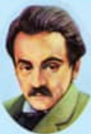
Жубон Халил ЖУБОН, араб алиби ва файласуфи

Кечинки кичинда гапларини кўнглини тас килиб, узи биринчи айтинга ухтайб сезмасан, шузда иншоий етилган бўлаган.