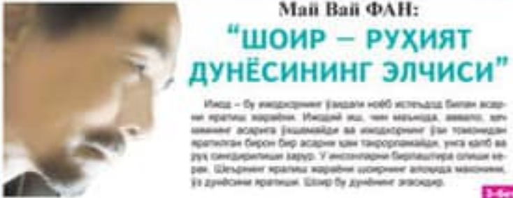
Май Вай ФАН: "ШОИР – РУҲИАТ ДУНЁСИНING ЭЛЧИСИ"