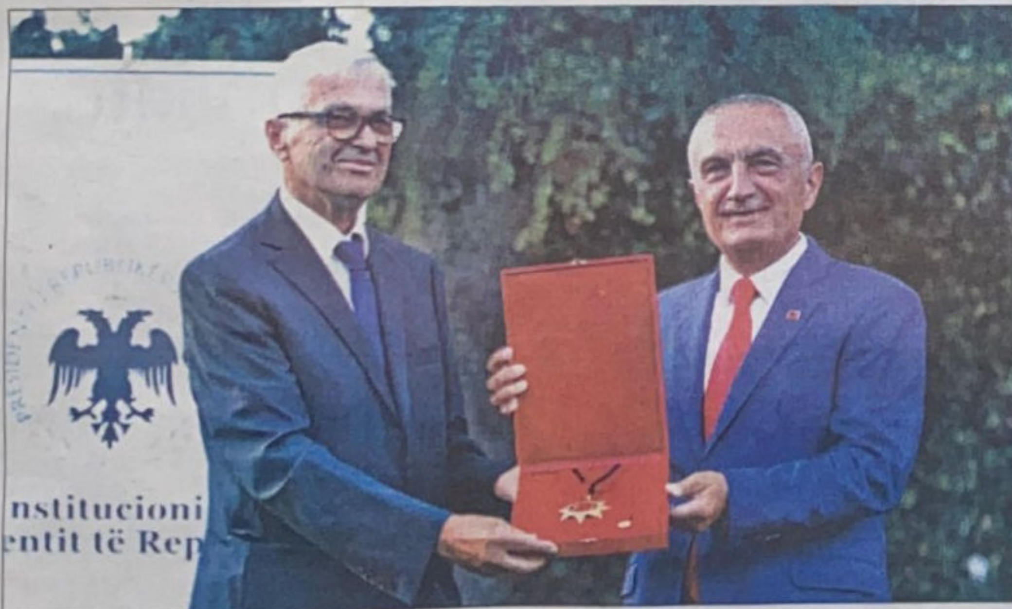
Në foto: Presidenti Ilir Meta dhe ish-Presidenti Rexhep Meidani, dje gjatë ceremonisë së dekorimit të zhvilluar në Presidencë.