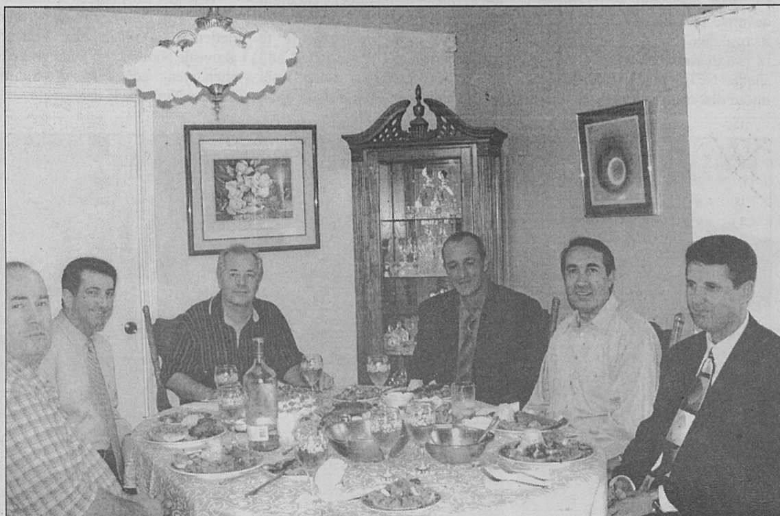
Çast nga dreka