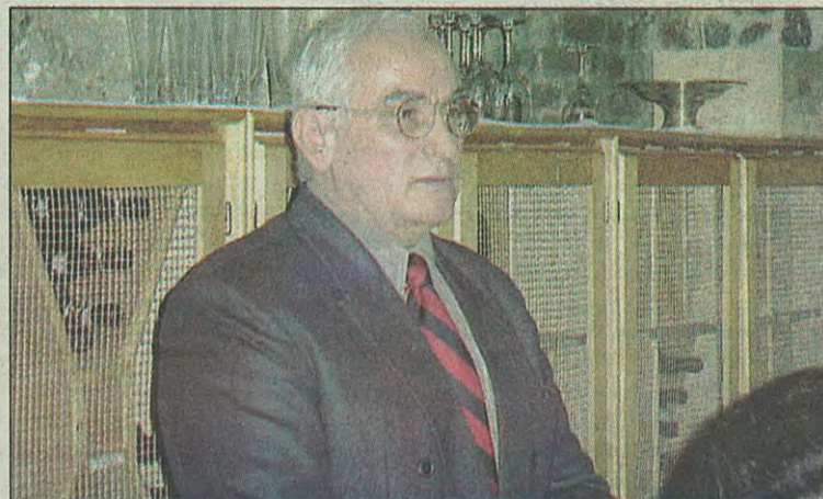
Viktor Martini duke përcjellë mesazh tolerance