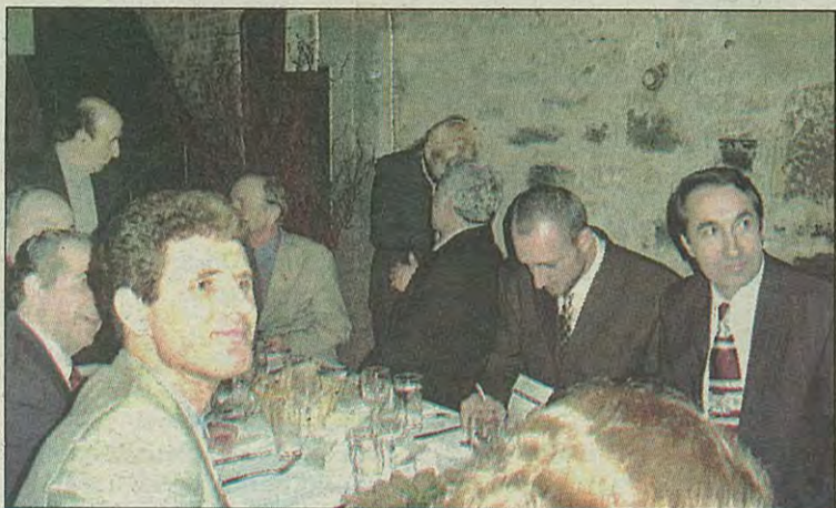
Pjesëmarrësit duke ndjekur aktivitetin