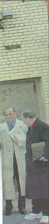
kujtimit gjatë takimit

het si inisiatori i saj. Rruga që ka përpara shoqata është e panjohur. Por duke gjykuar nga kompetencat e drejtuesve të shoqatës, mendoj se ajo premtion punë të mira, në dobi të letërsisë dhe kulturës shqiptare.