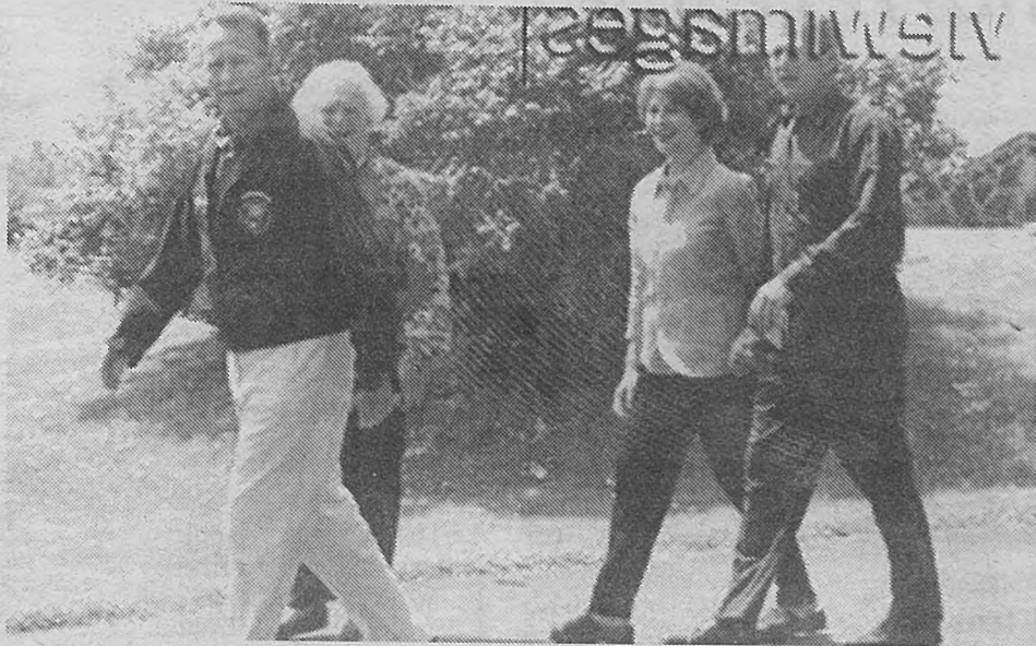
George Bush me gruan dhe djalin George (i riu) kandidat për president i SHBA-së

këtë çështje ? "Ç' duan të thonë, nëse do ta kisha kryer detyrën si duhet?"