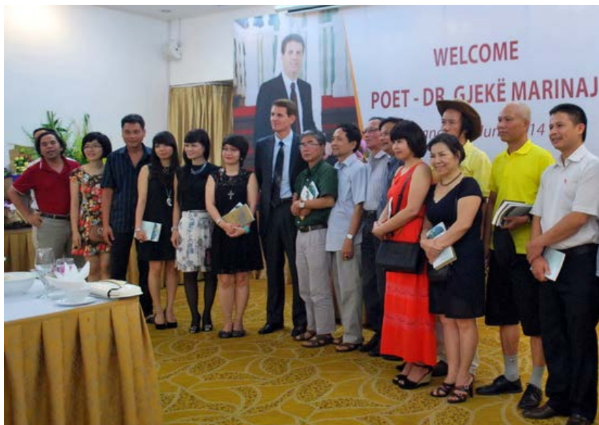
Nhà thơ - Tiến sĩ Gjekë Marinaj và những người bạn Việt Nam

Người đốt tâm can ta khi người cất tiếng, Và cứ đốt không thôi như ai kia phì phèo điều thuốc.