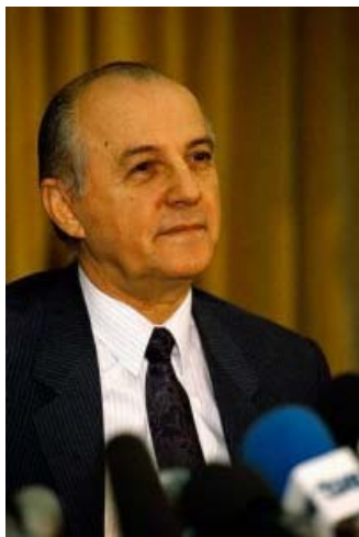
Ramiz Alia, 1980