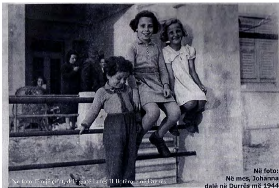
Në foto fëmijë cifut, dalë gjatë Lufës II Botërore në Durrës